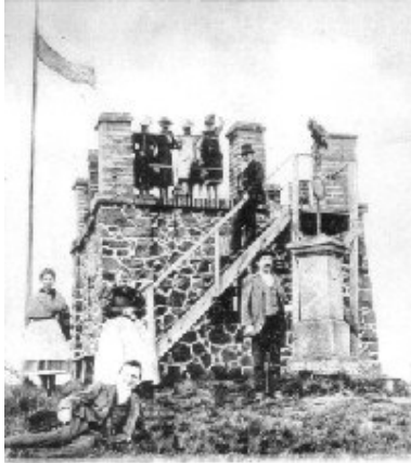
Kamenná chatka s rozhlednou z roku 1892

Lovoš, jedinečná krajinná dominanta Lovosic, imponantně vystupující z lovosické roviny do výšky 570 metrů nad mořem. Ke kuželovité vrchní části tvořené čedičem je připojen asi o 80 metrů nižší vrchol Kibičky, nazývaný též „Malý Lovoš“. Rozhled z vrcholu Lovoše na panorama Českého středohoří, údolí Labe a Lovosic je překrásný.